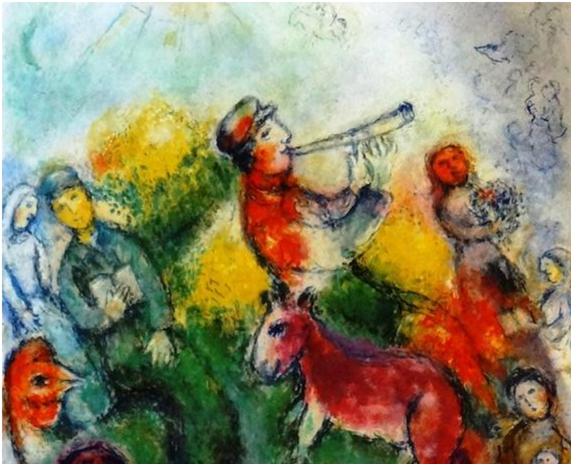
Marc Chagall: Rosj Hasjana (joods nieuwjaar, 15/17 september)