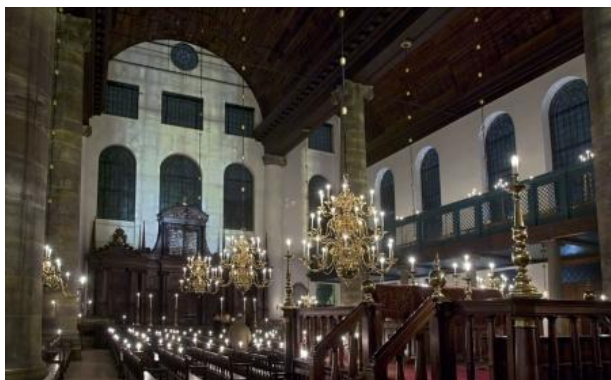
Interieur van de Portugese Synagoge te Amsterdam die zonder de aanwezigheid van elektrisch licht door kaarsen moet worden verlicht.