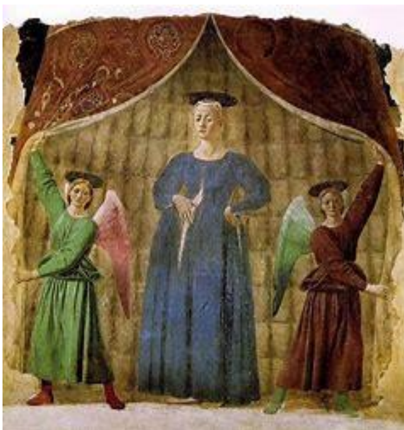
De zwangere Maria, Piero Della Francesca (Arezzo, museum Civico)