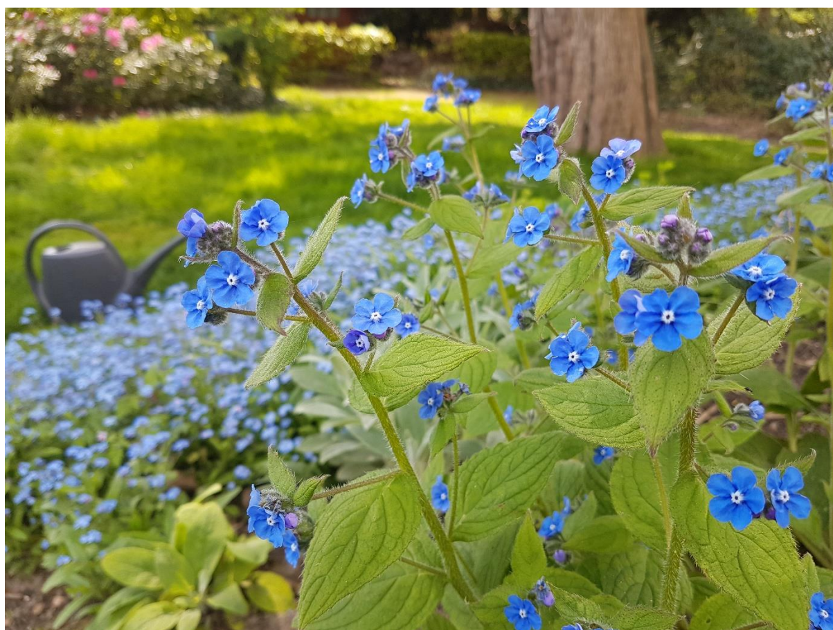
zomer in de kerktuin: brunnera macrophylla/kaukasisch vergeet-me-nietje