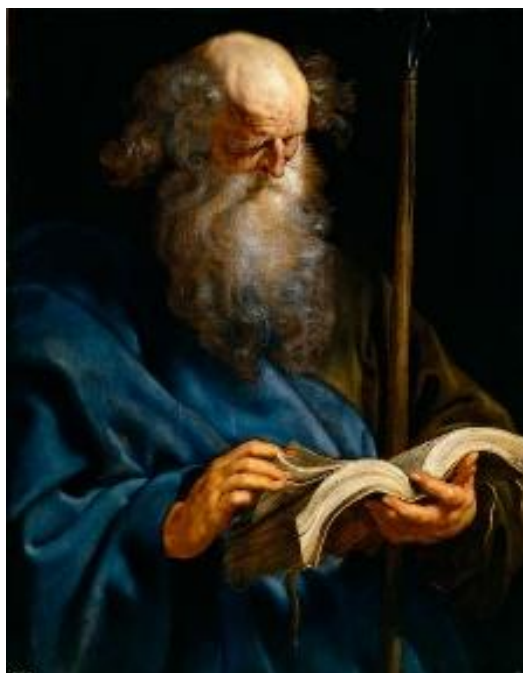
De apostel Thomas - Peter Paul Rubens (1577 – 1640)

(1 Petrus 2:2 'Als pasgeboren kinderen')